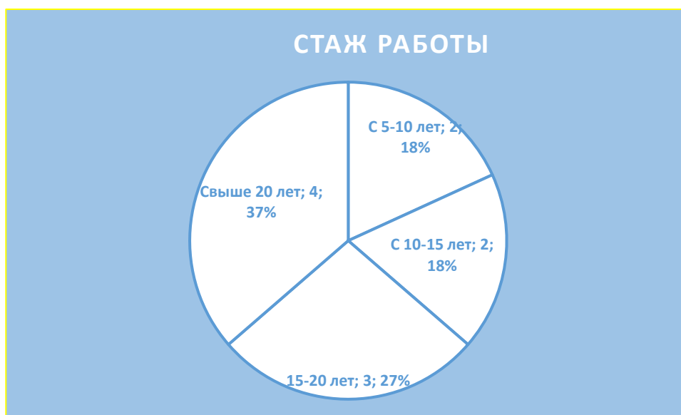
Рисунок 1. Педагогический состав, стаж работы

Для удобства информация представлена в виде диаграммы: